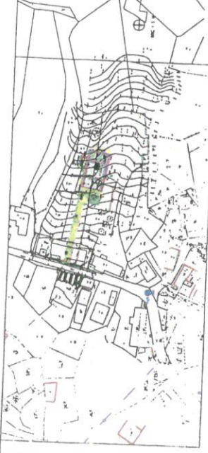
SITUÁCIA ŠIRŠIE VZTAHY 1:2000